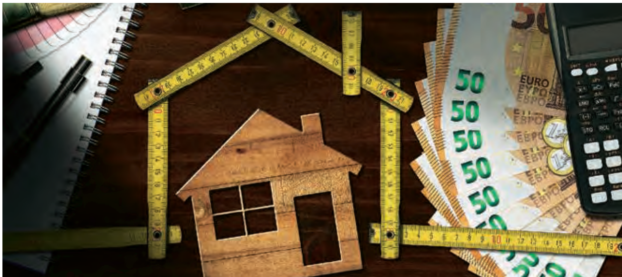
MASSTAB: Eine Finanzierung muss die individuelle Situation des Käufers berücksichtigen

alphabetische Sortierung; Quelle: ServiceValue