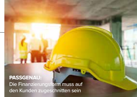
PASSGENAU: Die Finanzierungsform muss auf den Kunden zugeschnitten sein

Um die Stärken und Schwächen der Anbieter näher zu beleuchten, definierten die Fachleute fünf Fairness-Kategorien und ordneten ihnen die Attribute zu. Für jeden Bereich ermittelten sie anschließend eine Teilnote. Unter Berücksichtigung der