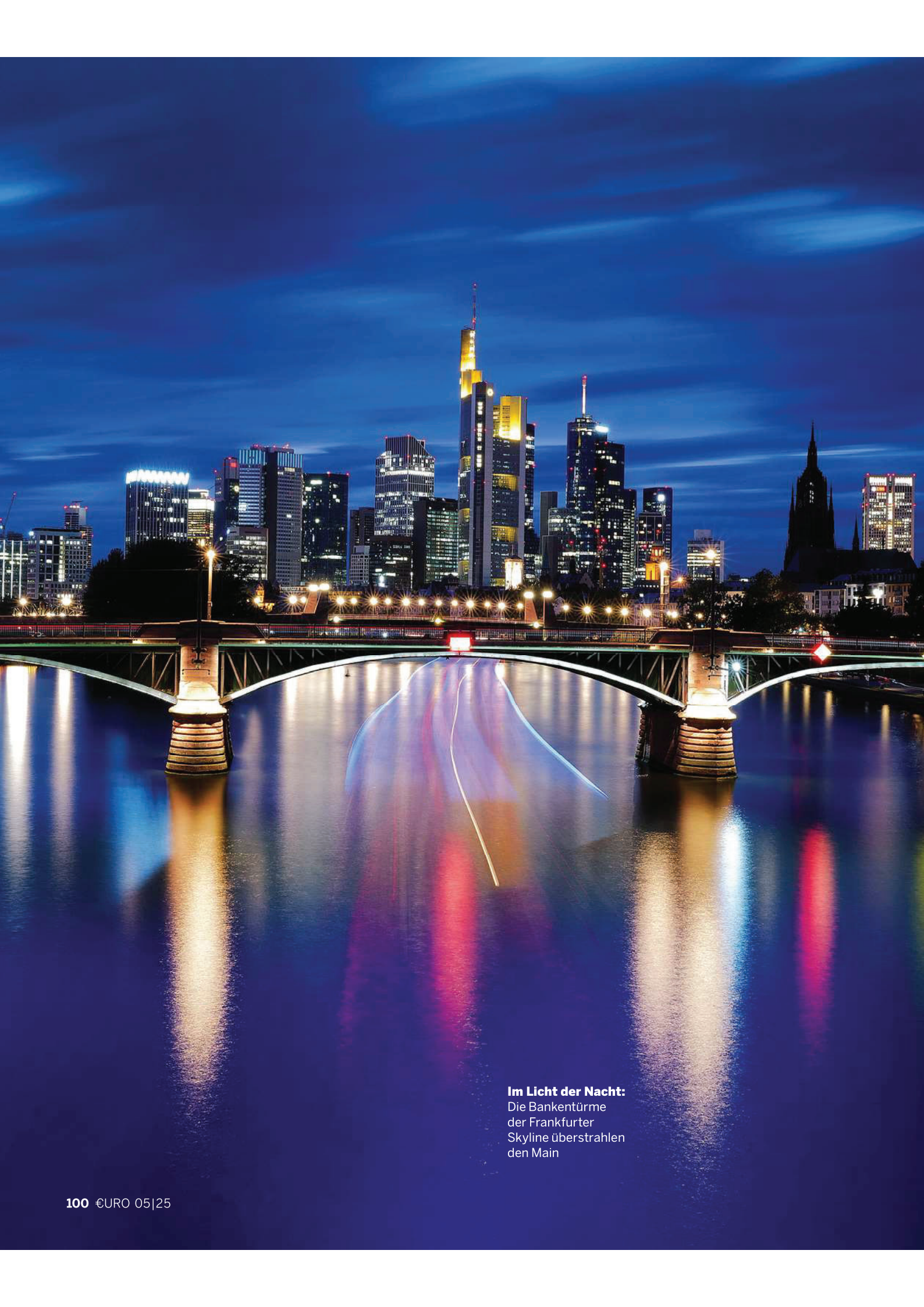
Im Licht der Nacht: Die Bankentürme der Frankfurter Skyline überstrahlen den Main