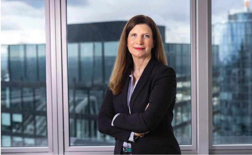
Ganz oben im Bankenturm: Neue Commerzbank-Chefin Bettina Orlopp